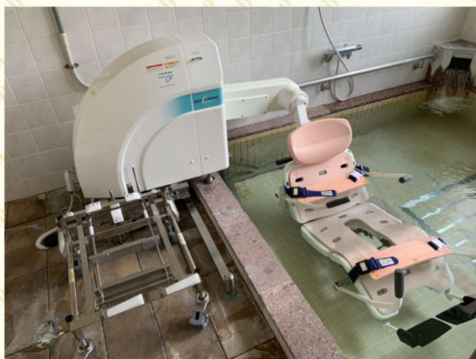
シャワーチェア昇降