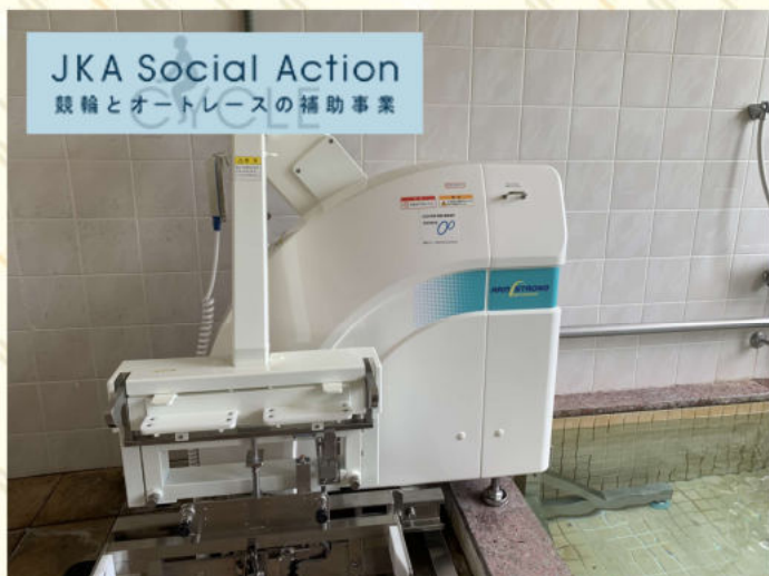
ウインドミル本体