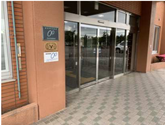
正面玄関標識取付状況