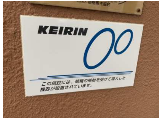
標識取付状況（拡大）