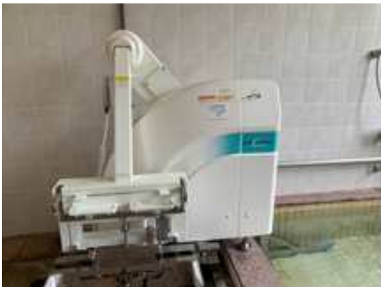
ウインドミル本体

https://www.amano-grp.co.jp/products/lift-nyuyoku/windmill/